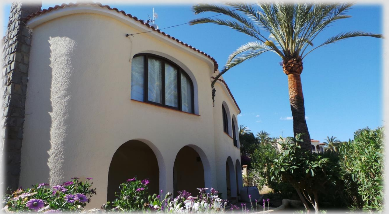
Típica vivienda mediterránea, con piscina particular y garaje