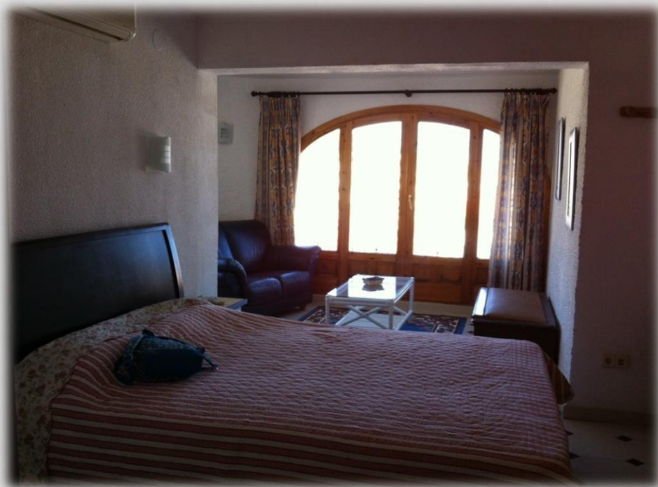
Habitación en planta principal con vistas al Mar