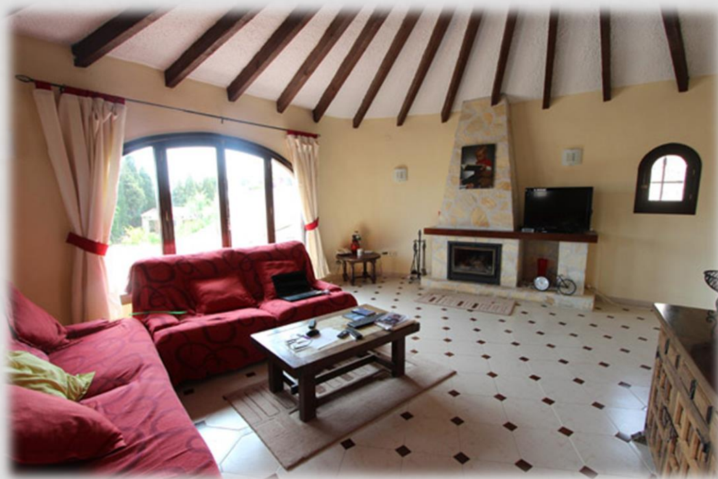
Salón con vistas al peñón de Ifach