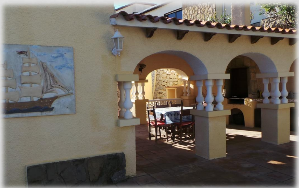
Porche con zona de barbacoa junto a la piscina