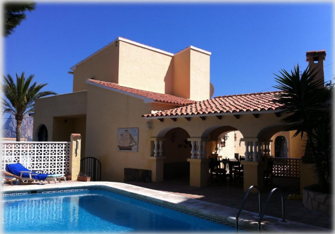
Piscina privada de 32m 2 (8m x 4m)