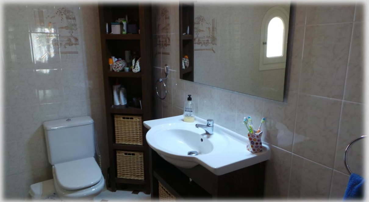
Baño completo y aseo en planta principal