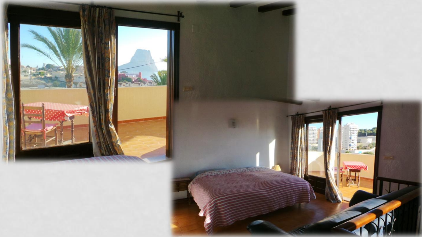
Habitación en planta superior, con acceso a terraza y fabulosas vistas